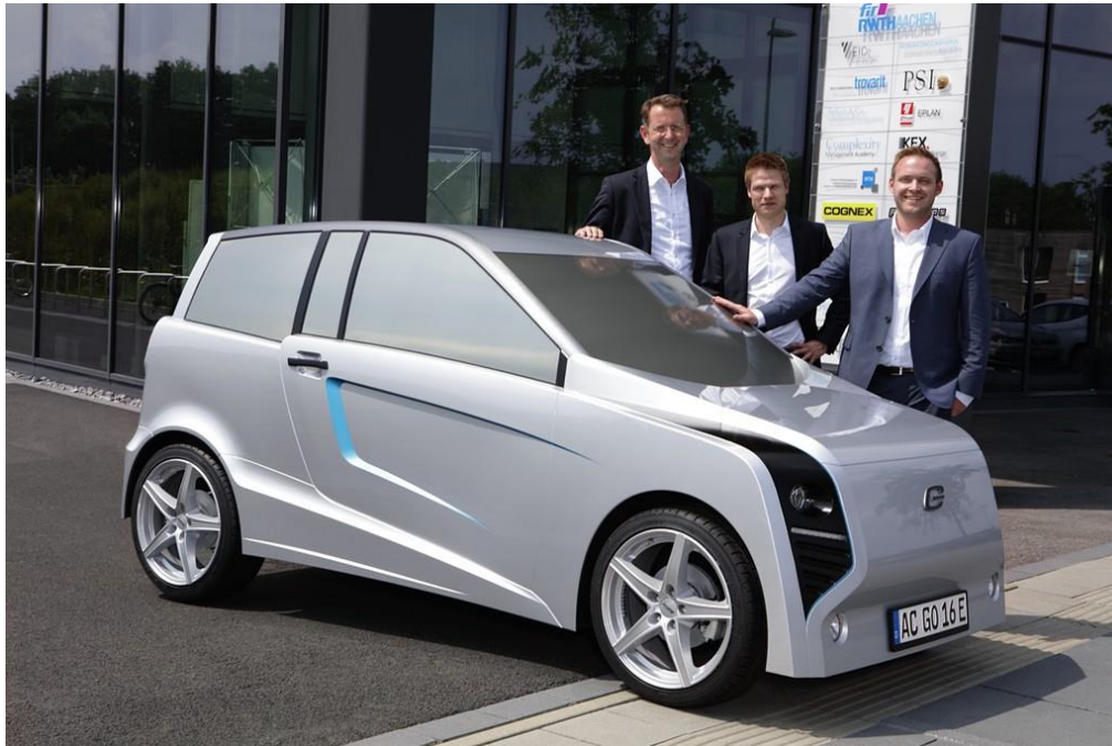
Abbildung 3: Elektroauto e.GO Life